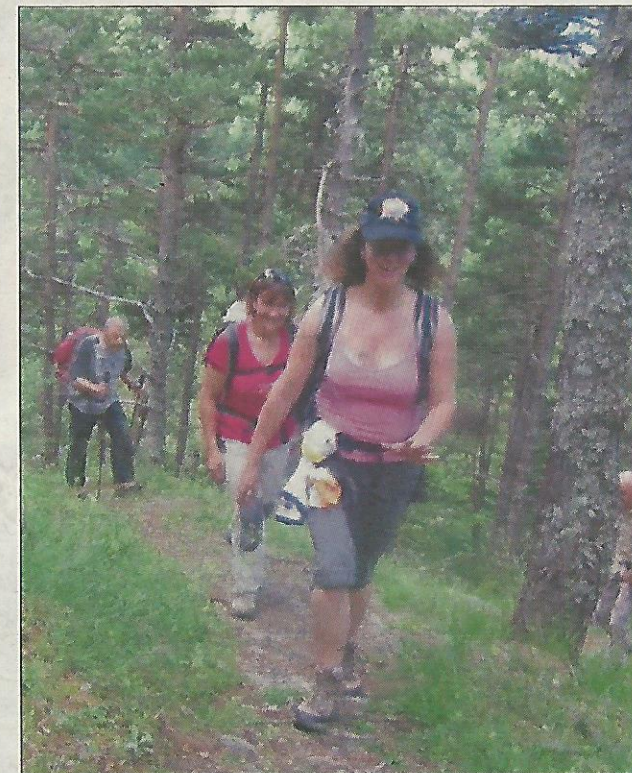
Le rendez-vous est fixé dimanche.