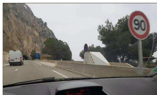
Le panneau « 90 », placé juste avant le radar, a beaucoup fait parler sur les réseaux sociaux.

(1) La préfecture précise que, durant quelque temps, le panneau de vitesse a été changé à 70 km/h, en raison d'un accident survenu le 3 mai dans le tunnel de La Girarde. Nécessitant la neutralisation d'une voie, et donc une réduction de la vitesse de 20 km/h. Le panneau - double face - a depuis été retourné pour indiquer de nouveau une limitation à 90 km/h.